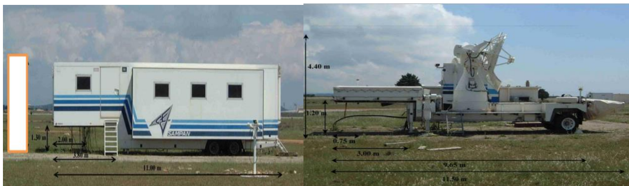
Radar T5 (Shelter : H=4.40 m ; L=12.70 m ; largeur=2.50 m ; masse = 4 T – Antenne : H=4.40 m ; L=9.65 m ; masse = 3 T)