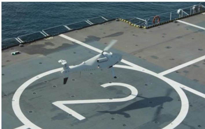
Drone aérien CAMCOPTER S-100