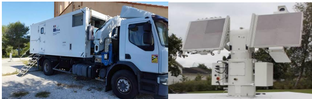
Radar WEIBEL (Shelter : H=2.33 m ; L=6.60 m ; largeur=2.29 m ; masse=4 T – Antenne : Diamètre=0.6 m ; H=2.00 m ; L=2.40 m ; masse=1T)