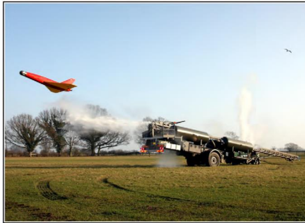
Cible aérienne BANSHEE sur sa rampe de lancement